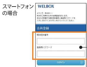
スマートフォンの場合

会員規約を確認し、お客様情報を入力して送信すると、WELBOX会員番号がメールで届きます。